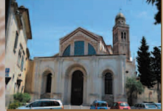
Santa Maria in Organo